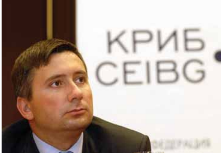
Увог от Председателя на Управителния съвет